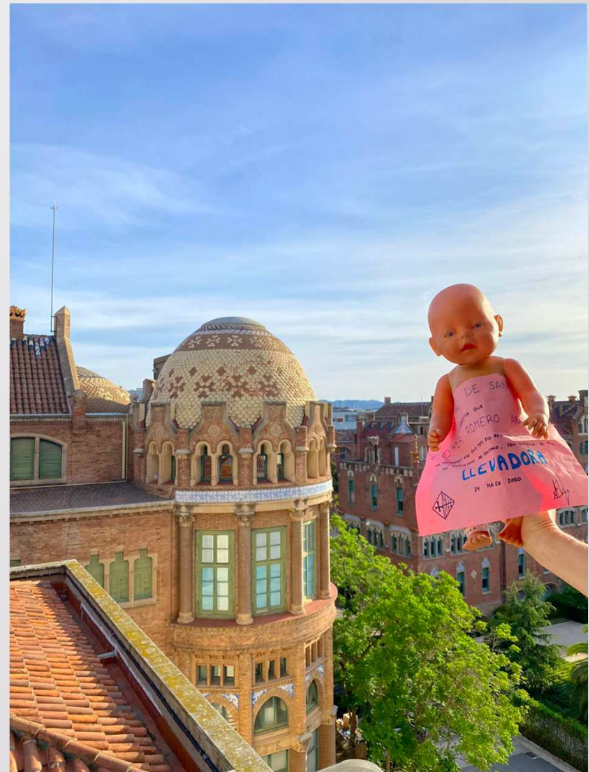
Residencia de Matrona en Sant Pau